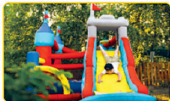
kids Play Area