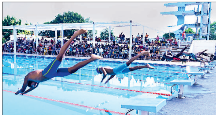
रोहताक। सीबीएसई राष्ट्रीय तैराकी प्रतियोगिता में भाग लेते प्रतिभागी।

कुल 60 प्रतियोगिताएं चार आयु वर्गों- अंडर-11, अंडर-14, अंडर-17 और अंडर-19 में आयोजित की गईं। हर मुकामले में खिलाड़ियों की तकनीक, एकाग्रता और जज्बे ने दर्शकों को प्रभावित किया