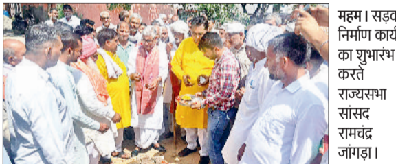
महम। सड़क निर्माण कार्य का शुभारंभ करते राज्यसभा सांसद रामचंद्र जांगड़ा।

महत्वपूर्ण योजना है, जिसका उद्देश्य महिलाओं को सशक्त बनाना और लैंगिक समानता को बढ़ावा देना है। यह योजना जिला में प्रभावी रूप से लागू की जाएगी। योजना के तहत प्रत्येक पात्र महिला को प्रतिमाह 2100 रुपए की वित्तीय सहायता मिलेगी, ताकि वे वित्तीय रूप से आत्मनिर्भर बन सकें। उन्होंने अधिकारियों को निर्देश दिए योजना के क्रियान्वयन के लिए व्यापक भागीदारी सुनिश्चित करने हुए पात्र महिला लाभार्थियों का पंजीकरण करवाना सुनिश्चित करें।