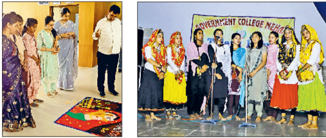
महम। छात्राओं द्वारा बनाई गई रंगोली का अवलोकन करते प्रिंसिपल व प्राध्यापक व गायन प्रतियोगिता में भाग लेती राजकीय महाविद्यालय महम की छात्राएं।